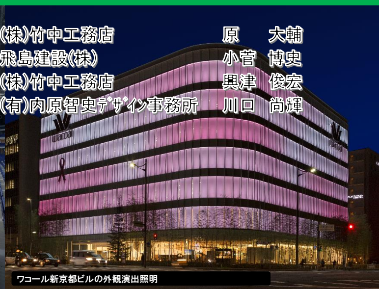
ワコール新京都ビルの外観演出照明